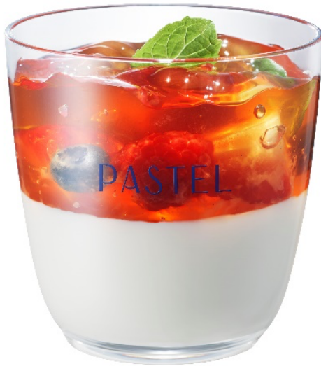
「東方美人茶プリン」